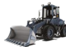
KOMPAKTOWE ŁADOWARKI KOŁOWE