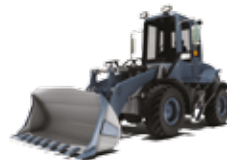
KOMPAKTOWE ŁADOWARKI KOŁOWE